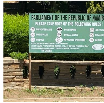
Windhoek od. Walvis Bay

Without deviation from the norm progress is not possible.