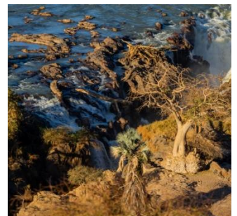
Epupa Falls Lodge